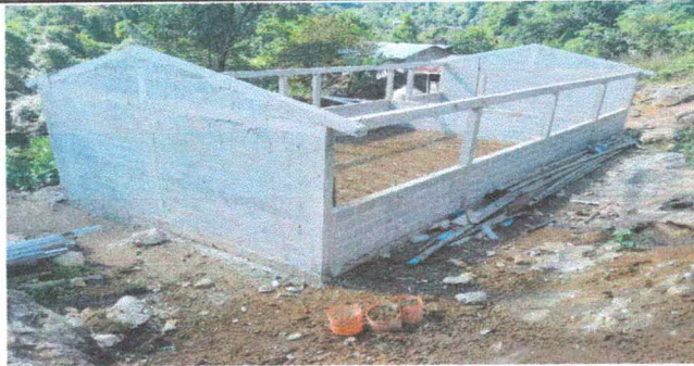
Foto 1: 100% La colocación de block y columnas del unico modulo del establecimiento.