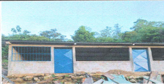
Foto 3: Instalada las puerta con chapa yale y balcon 122cm x188cm