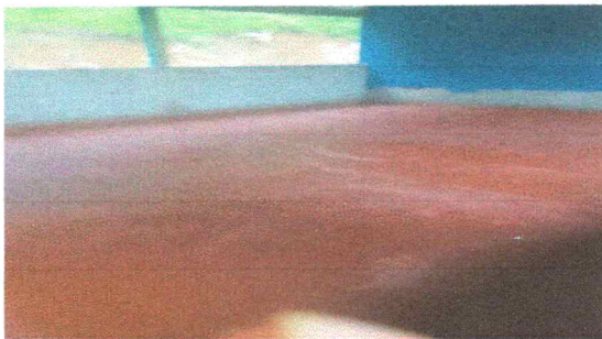
Foto 5: 100% finalizado la instalacion de piso en el unico modulo del establecimiento.